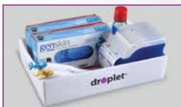
Ideal para almacenar o transportar productos de laboratorio