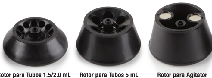
Rotor para Tubos 1.5/2.0 mL Rotor para Tubos 5 mL Rotor para Agitador